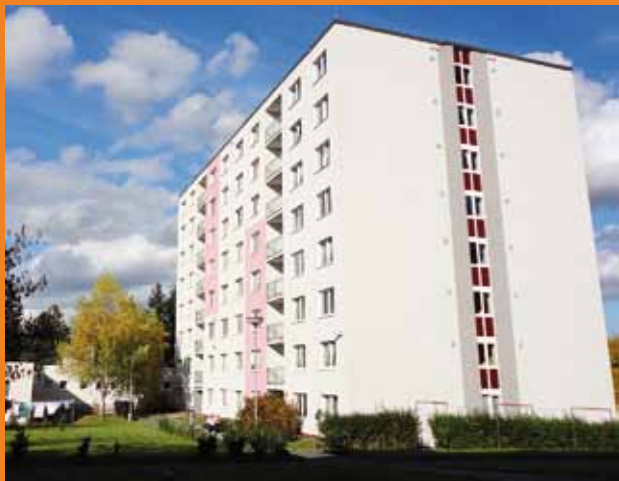
Budova Domova pro seniory v Klatovech po rekonstrukci. Pohled ze zadní strany.

Ve stejném roce, tedy v roce 1994, přebírá MěÚSS správu azylových domů (součástí domů je sociální ubytovna) v Koldinově ul. v Klatovech.