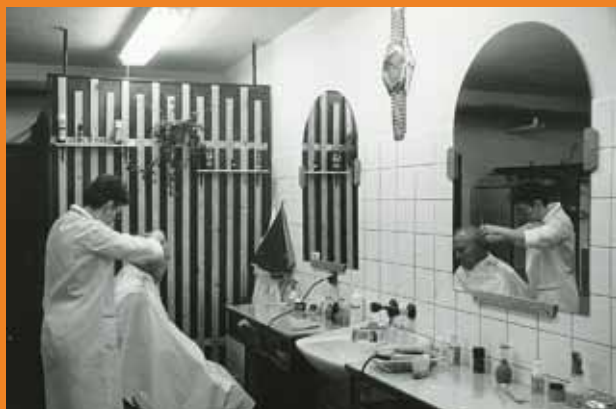
Kadeřnictví v prostorách Domova pro seniory v Klatovech v devadesátých letech 20. století.

Našim klientům pomáháme také vyplnit volný čas. Samozřejmostí je nabídka široké škály denních volnočasových aktivit - kulturní i sportovní vyžití, kvízy, hry, soutěže, oslavy lidových tradic, každoroční ples, výlety, tematické besedy či přednášky zajímavých hostů, návštěvy kina, muzea, výstav, ale také „jen“ procházky nebo mlsání v cukrárně. Pyšní jsme na místní knihovnu, která čítá téměř 3500 kvalitních titulů od známých i méně známých spisovatelů. Další naší pýchou je časopis Echo, který vydáváme třikrát do roka. Jeho úkolem je klienty nejen pobavit. Má svoji nezastupitelnou informativní funkci o dění v domově, o právech a povinnostech klientů, apod.