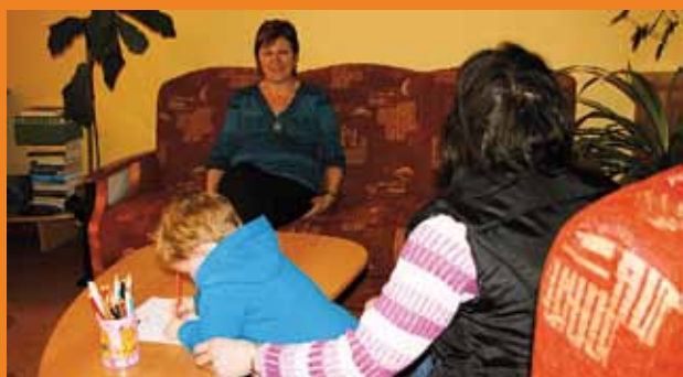
Konzultace v poradně.

Naše služby můžete využít v náročných životních situacích v různých fázích života. Umíme Vám pomoci při hledání řešení problémů osobních i rodinných, pomoci zorientovat se při rozhodování při rozhodování v dalším studiu, pomáháme při řešení partnerských neshod nebo nedorozumění. Dále se zaměřujeme na finanční a dluhové poradenství, pomáháme klientům orientovat se v dávkách státní sociální podpory a hmotné nouze, včetně pomoci s vyplněním potřebných formulářů. V hojné míře pomáháme rodičům při uspořádání péče o dítě v rozvodových kauzách, při vytváření dohod o rodičovském styku a podobně.