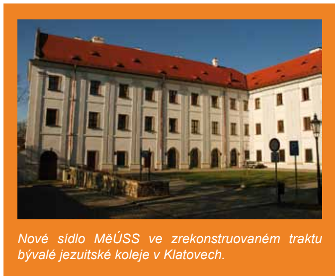
Nové sídlo MěÚSS ve zrekonstruovaném traktu bývalé jezuitské koleje v Klatovech.

Se ctí dnes můžeme konstatovat, že zaměstnanci naší organizace jsou na výborné profesionální úrovni. Podporujeme celoživotní vzdělávání zaměstnanců, proto našim klientům poskytují sociální péči kvalifikovaní pracovníci, kteří si stále rozšiřují nebo zvyšují svoji odbornost.