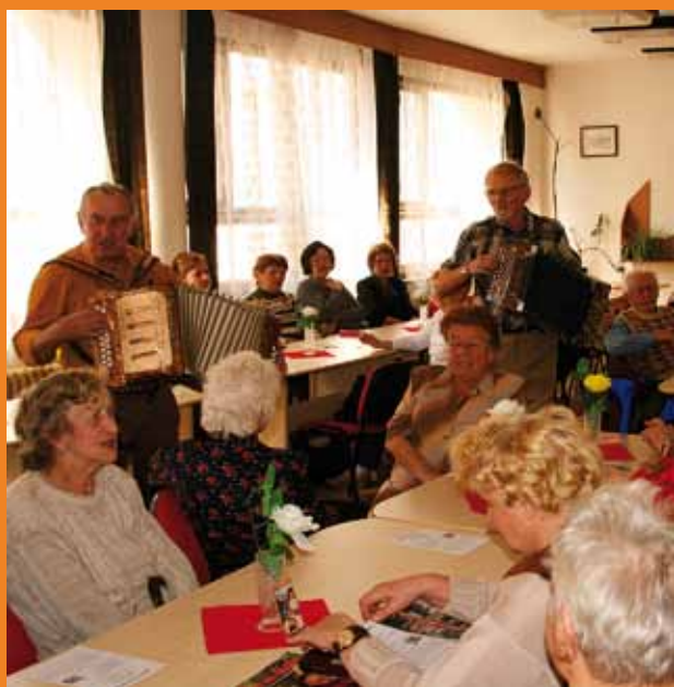
Členové Klubu seniorů v Klatovech se scházejí pravidelně každou středu odpoledne.

Každý všední den jsou klientům nabízeny jiné aktivity. Například rukodělná výroba, cvičení, trénování paměti, nebo se scházíme s klienty domova pro seniory v kavárně. Mimo pravidelných akcí pořádáme setkání s dětmi z klatovských škol, posezení s heligonkami, besedy, oslavy lidových tradic nebo různé výlety. Jako další službu nabízíme zájemcům dopravu klientů do centra denních služeb a zpět domů.