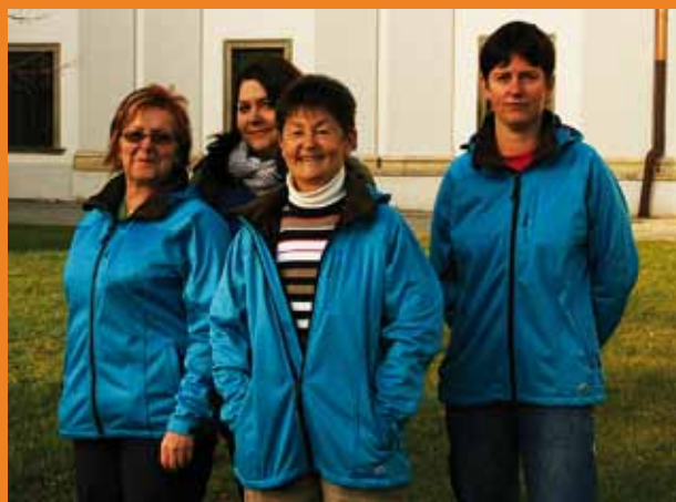
Tým domácí ošetrovatelské péče.

D omáci ošetrovatelská péče je zajišťována na Klatovsku již od roku 1995. Dnes ji zajišťují čtyři registrované zdravotní sestry a v průběhu roku ošetří více než sto občanů z Klatov a blízkého okolí. Důležité je, že krátkodobá i dlouhodobá péče je poskytována klientům v jejich domácím prostředí. Hlavní ideou domácí ošetrovatelské péče je umožnit klientům zajištění zdravotní péče doma a eliminovat potřebu hospitalizace nebo umístění v pobytovém sociálním zařízení. Cílem naší služby je udržet pacienty v jejich domácím prostředí co nejdéle je to možné. Ke klientům přistupujeme diskrétně a naším krédem je zachování jejich soukromí a důstojnosti.