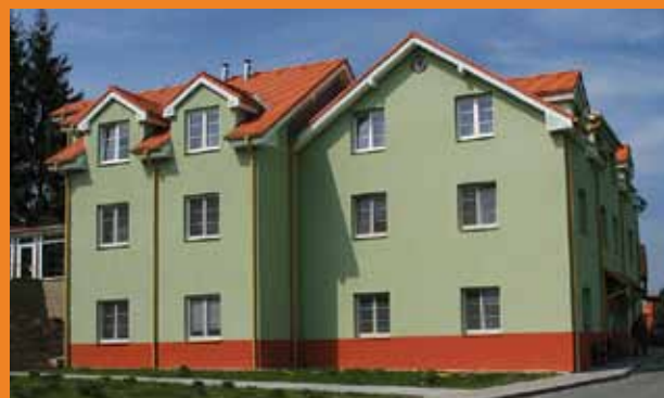
Budova Domova pro osoby se zdravotním postižením v Újezdci před a po rekonstrukci.

to, ale také tady společně s klienty trávíme odpoledne u zahradního grilu, besedujeme v dřevěném altánu nebo jen tak sedíme a užíváme si ticha přírody či štěbetání ptáčků. Součástí zahrady je sportovní hřiště a také na něm užijeme společně mnoho legrace.