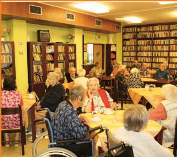
Společenská místnost Domova pro seniory v Klatovech, ve které se konají pravidelně různé akce.

V prostorách domova jsou k dispozici našim klientům služby kadeřnice a pedikérky. Kiosek v domově nabízí ve všední dny klientům omezený sortiment základních potravin, pochutin a drogerie, větší nákup je možné obstarat v blízkých samoobsluhách. Pro věřící klienty jsou přístupny bohoslužby v místní kapli.