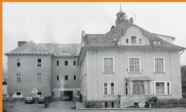
Budova Domova pro seniory v Újezdci před rozsáhlou rekonstrukcí.

T aké historie našeho domova si zaslouží ve zpravodaji své místo. Hlavní budova byla vystavěna původně jako zámeček. V drženém objektu se vystřídalo mnoho soukromých majitelů. Poslední majitel jej v roce 1922 prodal Revizní radě hornické v Plzni. Rada zřídila v objektu hornickou zotavovnu, která svému účelu sloužila až do protektorátu. Pamětní knihy dokladují, že v období druhé světové války bylo zařízení využíváno pro válečné účely. Po válce převzal budovu Státní statek Veselí za účelem vybudování zemědělského učiliště.