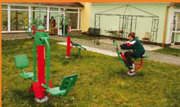
Relaxační místo na zahradě.

Domov je určen pro osoby, které z důvodu zdravotního postižení nemohou žít ve svém domácím prostředí. V našem zařízení poskytujeme klientům ubytování, stravování a potřebnou pomoc a podporu dle individuálních potřeb. Jmenované služby si klient hradí ze svého příjmu, služby za poskytování péče jsou hrazeny přiznaným příspěvkem na péči. V případě nízkého příjmu je klientům, stejně jako ve všech pobytových službách, zaručen 15 % zůstatku příjmu pro osobní spotřebu.