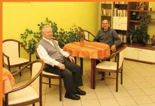
Jeden z pokojů a společenská místnost v Domově pro seniory v Újezdci.