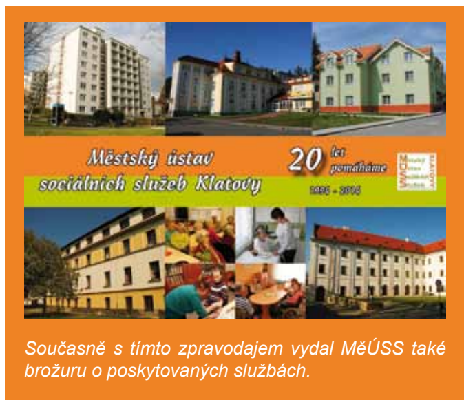
Současně s tímto zpravodajem vydal MěÚSS také brožuru o poskytovaných službách.