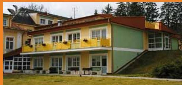
Část objektu Domova pro seniory v Újezdci. Zcela vlevo je hlavní vchod do budovy.

▷ Rok 1998 – probíhá rekonstrukce dvou pater objektu Domova – penzionu pro důchodce v Klatovech čp. 815/III na domov důchodců - dnešní názvosloví je domov pro seniory. Domov v Pavlíkově ul. byl s ohledem na havarijní stav zrušen a obyvatelé přestěhováni do tohoto zrekonstruovaného domova.