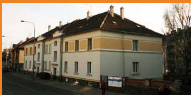
Azylové domy v Koldinově ulici.

Jednotlivci jsou ubytováni ve vícelůžkových pokojích se společným sociálním zařízením a kuchyňkou. Rodiny s dětmi bydlí v bytech, kde mají větší soukromí. Všechny pokoje i kuchyňky jsou vybaveny základním nábytkem a spotřebiči. Pokud klienti potřebují, zapůjčíme jim nádobí, lůžkoviny a další věci, které potřebují (dětská postýlka, dětská vanička, psací stůl, hračky). Tyto věci získáváme nejčastěji díky darům od lidí z řad veřejnosti.