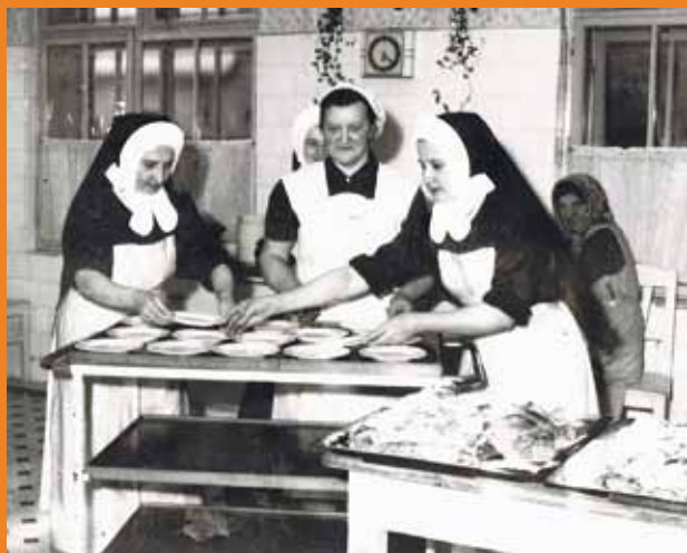
Řádové sestry, které v Domově důchodců v Újezdci působily v jeho počátcích.

Víme, že jedním z kritérií pro volbu domova je pro klienty naše rozlehlá zahrada a klidná lokalita. Nemůžeme sice pozorovat pohyb lidí a automobilů, ale oceňujeme klid, čistý vzduch a krásnou přírodu. Kdo nechce jen sedět, debatovat s ostatními nebo jen poslouchat ticho, může na zahradě využít seniorské hřiště. Cvičením na různých pomůckách tak může na čerstvém vzduchu udržovat svoji kondici.