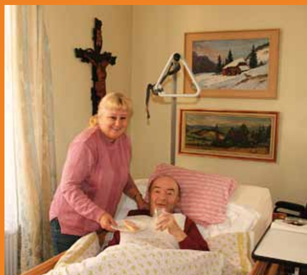
Pečovatelská služba přistupuje ke klientům vždy individuálně.

P ečovatelská služba je tradiční terénní sociální službou. Její historie vzniku sahá v klatovském regionu do roku 1972. Také naše služba prošla za dob svého působení velkými změnami.