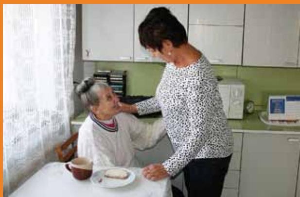
Služby pečovatelské služby jsou komplexní.

Cílem pečovatelské služby je umožnit lidem, kteří se nacházejí v nepříznivé sociální situaci setrvat ve svém domově. Pomáháme klientům zachovat vlastní životní styl i v těchto náročných životních obdobích.