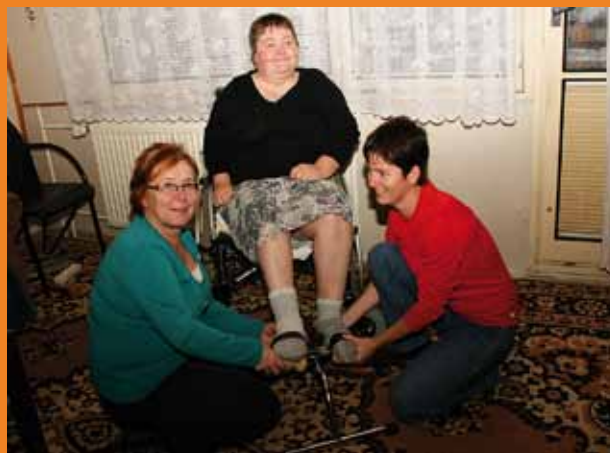
Sestry při provádění ošetrovatelské rehabilitace.

Potřebujete Vy nebo Vaši blízcí některé z našich služeb? Pak Vás bude jistě zajímat poslední informace. Jak je výše uvedeno, službu poskytujeme pouze na základě předpisu některého z výše zmiňovaných lékařů, a proto také úkony zdravotních sester hradí zdravotní pojišťovny.