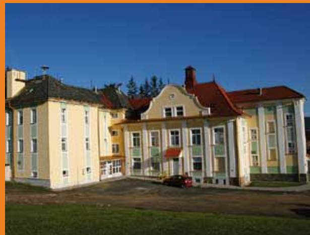
Někdejší zámek - nyní Domov pro seniory v Újezdci v současné době.

K dispozici je seniorům i tělocvična s rotopedem, masážním přístrojem a dalšími rehabilitačními pomůckami. Dva dny v týdnu je přímo v prostorách domova otevřen kiosek.