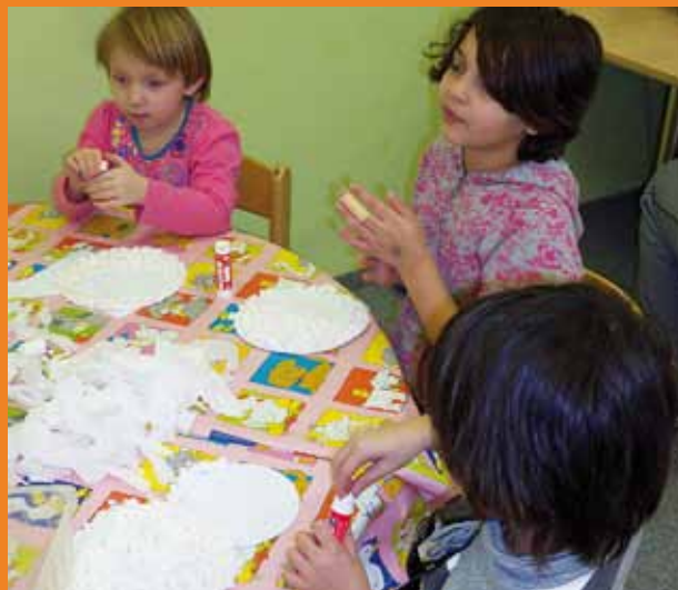
Pro děti jsou v Azylových domech připraveny různé aktivní činnosti.

Naši pracovníci poskytují klientům rady a pomoc při řešení různých životních situací, např. hledání vhodného zaměstnání, uplatňování nároku na sociální dávky, dluhová problematika, vyřizování nároku na starobní či invalidní důchod. Rodiče s dětmi mají možnost účastnit se akcí, které pro ně pořádáme. Dětem se věnujeme i v oblasti vzdělávání, snažíme se ve spolupráci s rodiči, aby si děti osvojily dovednosti a vědomosti přiměřené jejich věku. Naším cílem je pomoci klientům zapojit se do života běžné společnosti. Pracujeme společně s klientem na tom, aby byl schopen najít si jiné vhodné bydlení, které má dlouhodobější charakter.