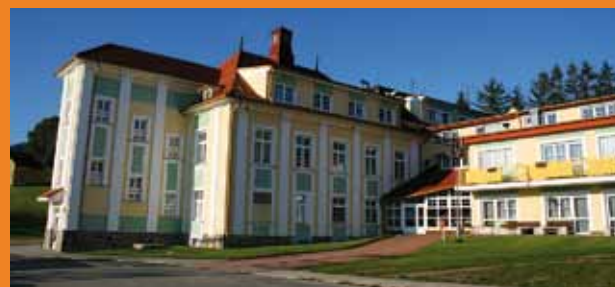
Domov pro seniory v Újezdci.

▷ V roce 2010 byl v Koldinově ul. zřízen dům na půl cesty.