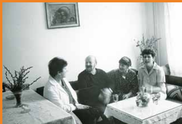
Byt pro manžele Domova – penzionu pro důchodce v Klatovech v devadesátých letech 20. století.

Ruku v ruce s rozšiřováním kapacity se rozrůstal také pracovní kolektiv tak, abychom mohli dostát svým cílům poskytování kvalitních a bezpečných sociálních služeb. Na pracovníky domova se můžete obrátit v případě, že hledáte pomoc pro sebe, svého blízkého, příbuzného či známého. Ale také v případě, pokud se potřebujete o podmínkách a možnostech služby pouze informovat. Jsme zde pro ty, kteří potřebují komplexní péči od ubytování, zajištění stravy a poskytování péče o vlastní osobu. Snažíme se pomoci tam, kde pobyt v domácím prostředí není možný z důvodu zhoršeného zdravotního stavu. Ke klientům přistupujeme individuálně a každému je poskytována péče v takové míře, jakou potřebuje a požaduje. Služba je plánována a poskytována v souladu s požadavky klientů.